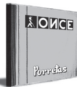
PORRETAS "Once" (B0A)

METAL Ruido de mil orcos. Este es el símil que viene a la cabeza tras la escucha de "Plague". Una plaga que opta por la brutalidad de las guitarras y los bombos, y estalla a flor de piel en cortes como "Under Experiment" o "His Cross In My Neck". El gazpacho de thrash, death metal y grind-core certifica bien la onomástica de los mostoleños. Todo bien cuadrado y esculpido con el arte que caracteriza a Carlos Santos (estudios Sandman) y Tony López. A colocar bien cerca de los discos de Pantera, Machine Head o Brutal Truth. ■ M. A. S. G.